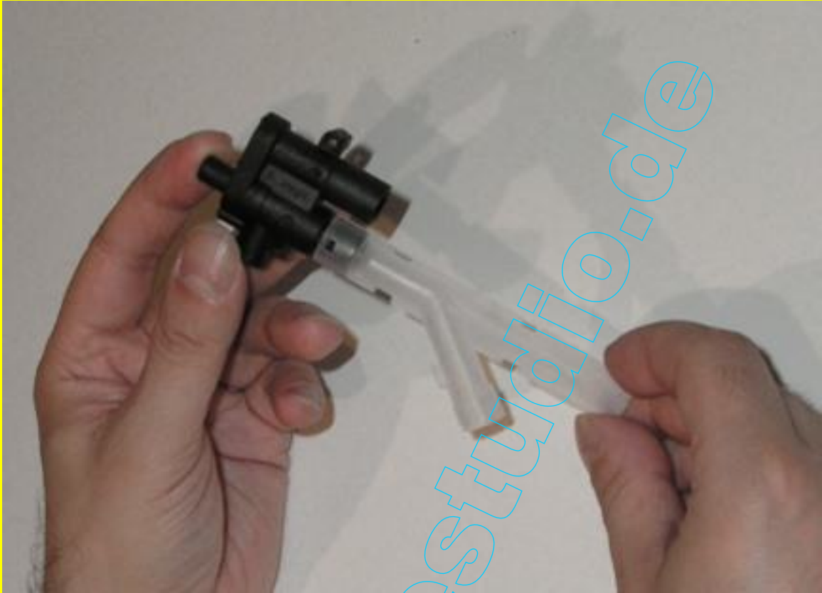
Das Drainageventil in Grundstellung.